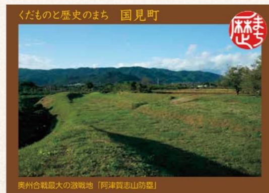
国見町は「阿津賀志山防塁」のカード

県内では国見町、白河市、磐梯町、桑折町、棚倉町の5市町で配布している歴史まちカード。