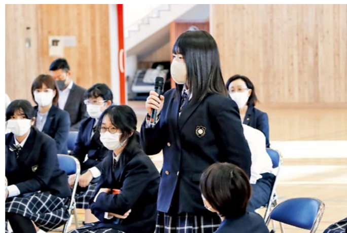
児童たちが「くにみ学園」に対する思いを発表しました

短い時間ではありましたが、次々に児童たちが発表する様子が見られるなど、くにみ学園に対する興味関心の高さを感じられたタウンミーティングとなりました。