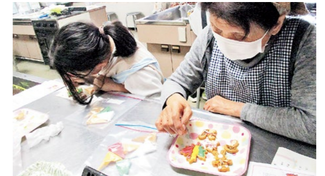
▲カラフルなクリームでクッキーを飾りつけました