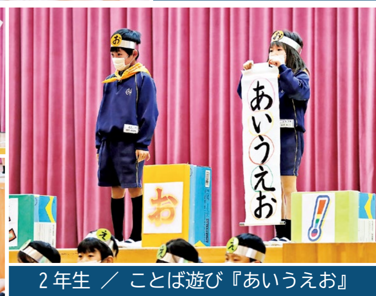
2年生 / ことば遊び『あいうえお』