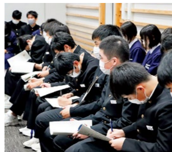
真剣にメモを取る生徒たち

国見町子ども議会が11月2日、国見町役場の議場で行われました。県北中学校3年生の生徒が子ども議長と議員になり、まちづくりに関する質問や提言をしました。