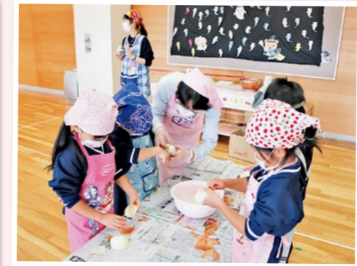
▲くにみ幼稚園カレーパーティーで、調理の補助を行う食生活改善推進員の皆さん

皆さんが健康で暮らすことができるよう、地域で食生活改善活動に励む国見町食生活改善推進員の皆さん。現在、ボランティアとして11人が活動しています。推進員の皆さんは、くにみ幼稚園の子どもたちに食育教室を開催し、正しい箸の使い方や食事のマナーなどについて指導したり、いきいきサロンではみそ汁の塩分測定等を実施し、減塩の必要性について話をするなど、各地域で食事の大切さを伝えていきます。 一緒に活動できる方を随時募集しています。食生活や健康づくりに興味のある方は、ほけん課保健係（☎585・2783）まで問い合わせください。