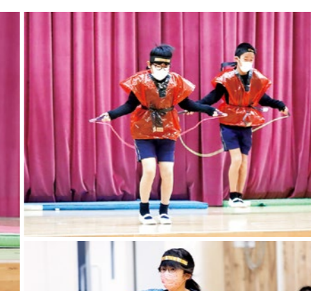
3年生 / あつかし忍者 参上!!