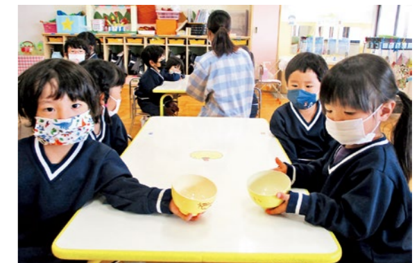
▲年少児「食事のマナーについて」