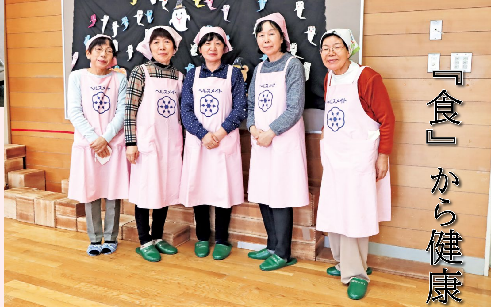
▲国見町食生活改善推進員の皆さん（くにみ幼稚園カレーパーティーにて）

【1人分の栄養価】 エネルギー 259kcal たんぱく質 13.0g 塩分 0.7g