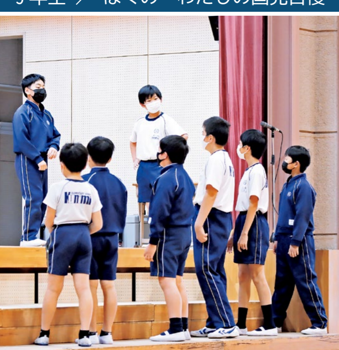
5年生 / ぼくの・わたしの国見自慢