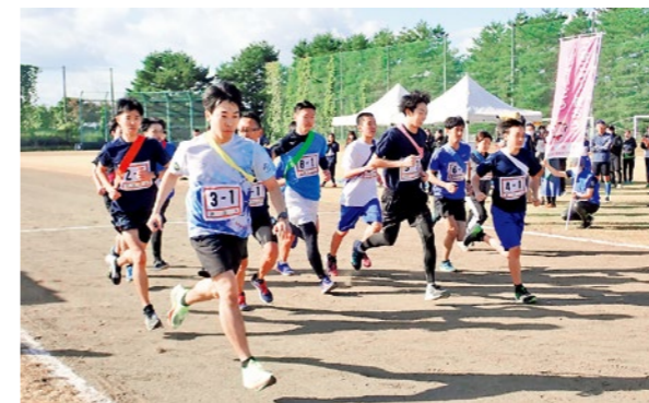
▲秋空のもと健脚を競いました

いろいろな発酵食品がある中でも、古くから食べられていて、腸内細菌のバランスを整えてくれる素晴らしい食品のヨーグルト。毎日継続して食べるのが大切だということ学びました。