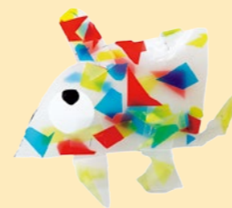
村上 くに 「おもしろびよびよこうさぎ」