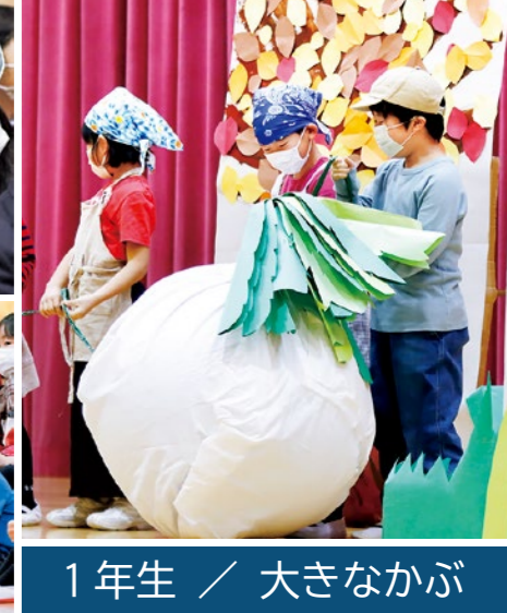
1年生 / 大きなかぶ