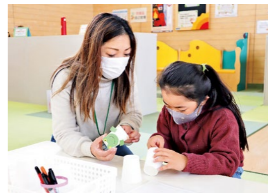
親子で協力しておもちゃを完成させました

訪れた親子たちは、思い思いに紙コップへ目や耳を貼付け、世界で一つだけの特別なおもちゃを完成させました。