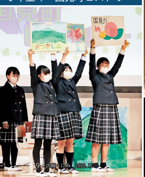
6年生 / 国見町ヒストリー

令和4年度国見小学校学習発表会が11月9日に行われました。新型コロナウイルス感染症の影響で、3年ぶりの開催となった国見小学校学習発表会。児童や保護者を入れ替え制にするなどの感染対策を講じ、国見小学校創立10周年の節目の年に再開することができました。子どもたちが練習の成果を発揮し素晴らしい発表を行うと、観覧に訪れた保護者から大きな拍手が送られました。