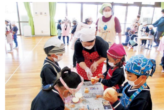
▲年長児「育てた野菜でカレーを作ろう！」

町では食生活改善推進員の皆さんと栄養士が、くにみ幼稚園の子どもたちを対象に食育教室を開催しています。10月・11月は下記の内容で実施しました。