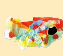
古溝 拓翔 「きれいなさかな」