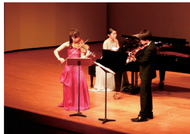
会場を魅了した“若い音楽家たちの演奏会”

文化芸術の普及・啓発を目的としたワンコインコンサートが観月台文化センターで、アウトリーチが道の駅国見あつかしの郷で3月30日、開かれました。第2回目となる今回は、東京の大学に通う3名の若い音楽家のINNOCENT(イノセント)が演奏しました。会場では、ピアノやヴァイオリンの美しい音色が響き渡り、多くの人が音楽を楽しむ機会となりました。