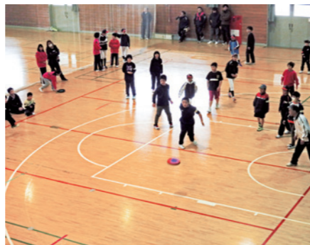
3月に開催されたスポーツ少年団交流大会でドッチビーを行う様子

※スポーツ少年団は、メンバーシップ制をとっており、年度毎の団員・指導者登録が必要となります。申込み期限は8月31日(土)までとなっています。