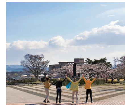
フィンランドからの留学生たち(観月台文化センターにて)

フィンランドの人たちは、幸せを感じる感度が高い。このことも、幸福度世界一の国と言われる理由の一つではないかと考えています。先日、フィンランドから仙台大学に留学に来ている学生たちが、国見町を訪れる機会に恵まれました。訪問中、留学生は数えきれないほど「幸せ」という言葉を発しました。青空に浮かぶ雲を見て、幸せ！子どもたちや町の方々との出会いに、信じられないくらい幸せ！そして、満開の桜の下で、「ここに住む人たちは最高に幸せね！」と。このフィンランド学生たちの幸せを感じるアンテナもまた、ピンと張っていました。幸せのアンテナを張ってみると、普段何気なく目にしている光景が、違って見えてくるかもしれません。