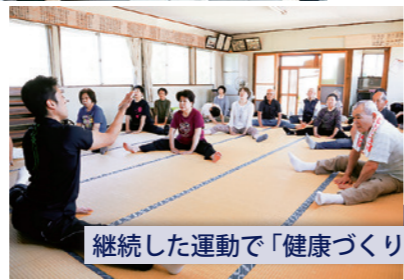
継続した運動で「健康づくり」