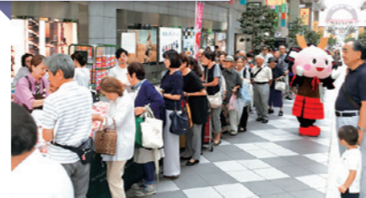
仙台圏との交流連携