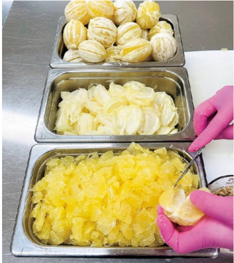
身と薄皮を丁寧に分ける。この作業が重要と話す

「世界一」となった裏側には、お二人の「いいものを作りたい」という探究心とアスリート並みの徹底ぶりがありました。