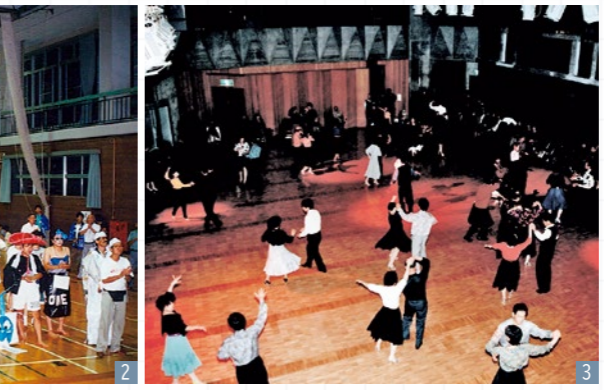
1 観月台文化センター落成記念式典 (H6) 2 国際青年交流村 (H6) 3 国見町文化祭ダンスパーティー (H7) 4 国見町小中学校音楽祭 (H10) 5 日独スポ少同時交流事業 (H7) 6 図書管理を電算化 7 成人式 (H16) 8 国見まつり (H18) 9 第1回観月台フェスティバル 10 東日本大震災発生・役場庁舎移転 11 少年親善交流事業・夏休みジュニア歴史探検隊 (H25) 12 森のおもちゃフェスティバル (H26) 13 ワンコインコンサート (H30) 14 国見町図書館リニューアル (R3) 15 くみにみ観月台カレッジ開講 (R4)