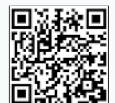
▲パブリックコメントの詳しい内容は、ホームページをご覧ください。