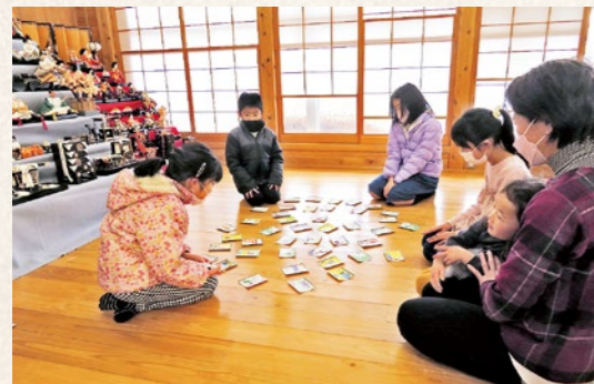
▲白熱した国見の民話かるた大会