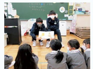
▲中学生の保育実習 このような中学生と幼稚園児の交流も簡単に