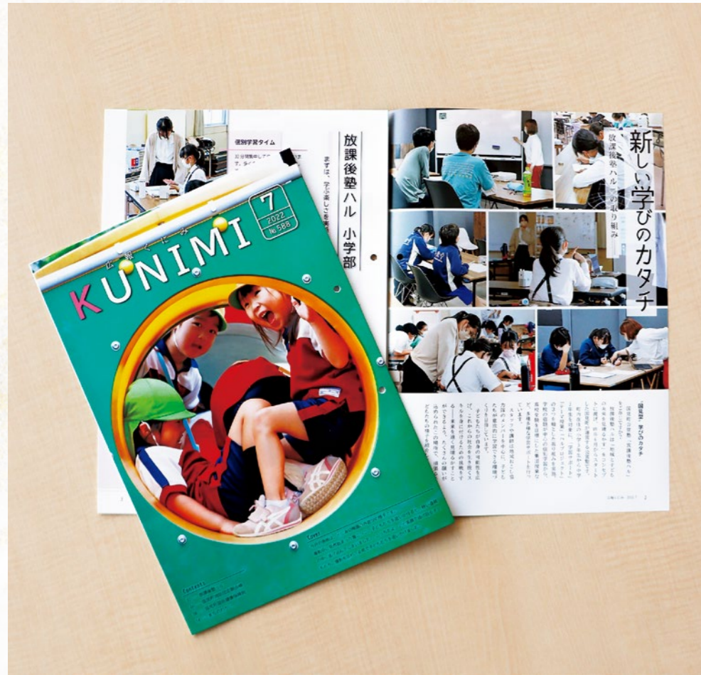
▲広報紙の部で佳作を受賞した7月号では「放課後塾ハル」を特集。一枚写真の部で特選を受賞した7月号の表紙は、くみ幼稚園の遊具で元気いっぱいに遊ぶ子どもたちの表情を撮影しました。