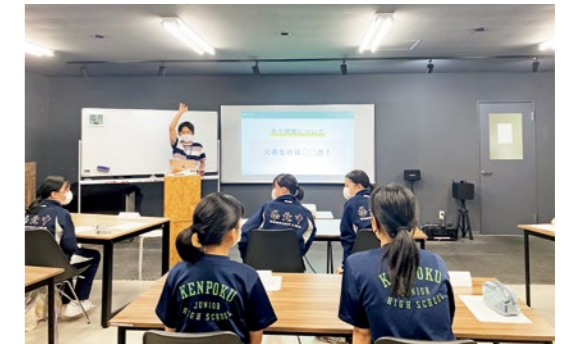
▲体験入塾会の様子