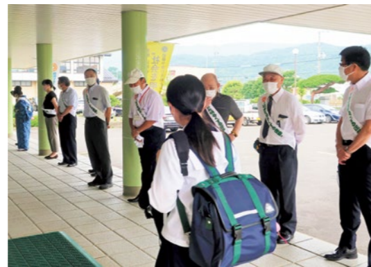
あいさつ運動を行う委員会の皆さん

生徒たちの登校時間に合わせ、保護司や婦人会の皆さんがあいさつ運動を実施。登校した生徒たちとあいさつを交わしながら、犯罪や非行のない社会づくりを呼びかけました。