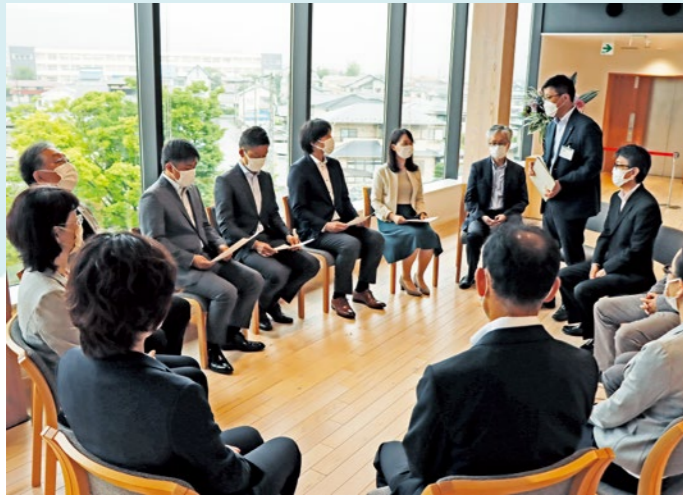
委嘱状交付式後に行われた懇談会の様子