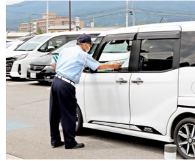
いつでも安全運転に努めましょう