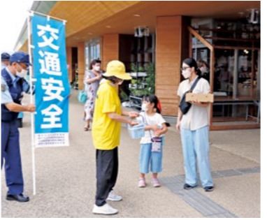
小中学生にも啓発活動を行いました

夏の交通事故防止県民総ぐるみ運動（7月16日～25日）の県下一斉強化日にあわせて町交通対策協議会は7月25日、道の駅国見あつかりの郷で交通安全啓発活動を行いました。 交通安全協会各支部や各地区交通安全母の会、警察署の皆さんが交通安全啓発のチラシやティッシュ、反射材を配布し、交通事故防止を呼びかけました。 今年は夏休み期間中に啓発活動を実施。参加者らは、道の駅に訪れた町内外の小中学生へ家族ぐるみでの啓発活動を行い、交通死亡事故ゼロを呼びかけました。