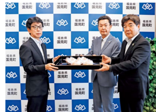
卵を贈呈する国見ライオンズクラブの皆さん