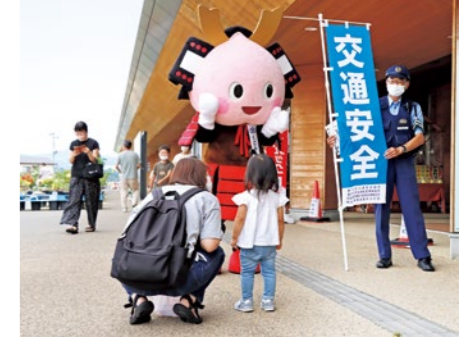
くにももたんも啓発活動に参加