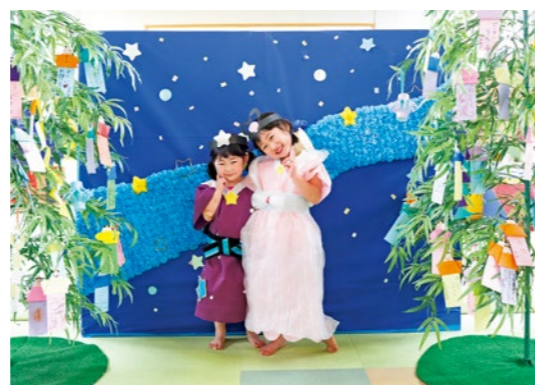
スタッフ手作りの衣装を着た子どもたち

くにみもたん広場では、子どもたちに七夕を楽しんでもらおうと七夕飾りを作り、展示しました。七夕飾りには、子どもたちが願い事を書いた短冊がたくさん。テーブルには短冊を前に、真剣な表情で願い事を考える子どもたちの姿も。子どもたちは、スタッフ手作りのフォトスペースで写真撮影をするなど、楽しいひとときを過ごしました。