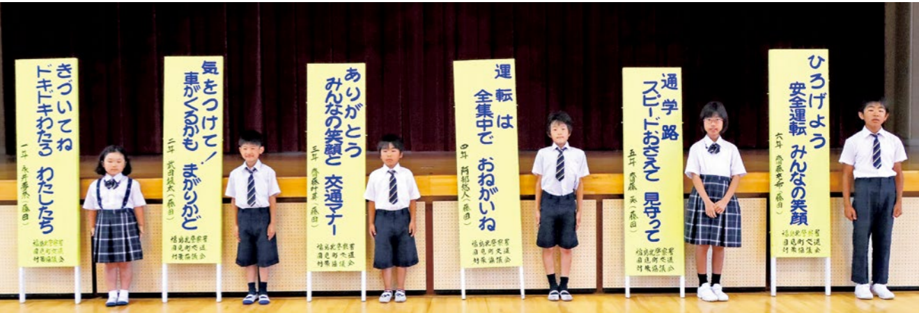
交通対策協議会長賞（最優秀賞）を受賞したみなさん