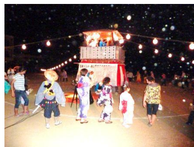
旧小坂小学校庭での豊年仮装盆踊り