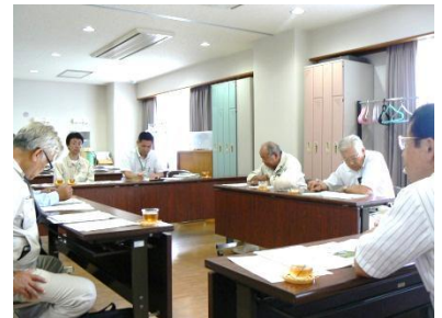
あんぼ柿の状況を聞き取り