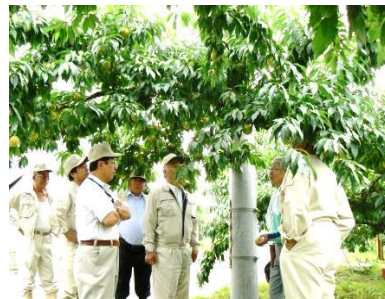
小坂地区の桃畑を現地調査