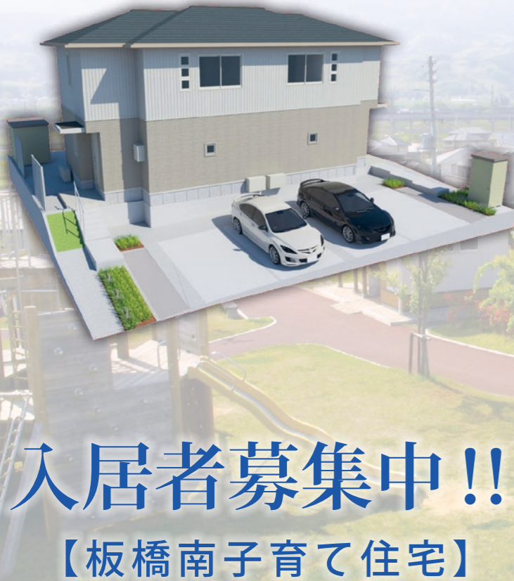
▼ 1号棟外観イメージ図

1_1号棟寝室 2_1号棟リビング 3_2号棟リビング 4_2号棟寝室 ※画像はすべてイメージ・家具等は付属していません