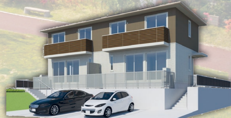
▲ 2号棟外観イメージ図