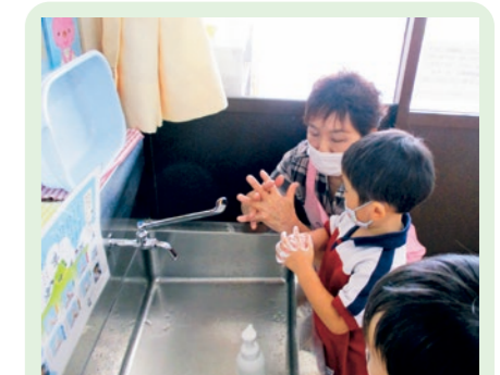
手洗いの大切さについて(年少組)