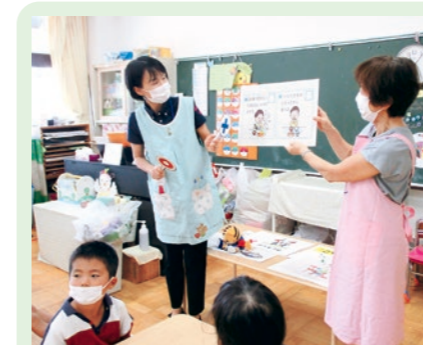
食事のマナーについて(年長組)

町では、食生活改善推進員のみなさんと栄養士が、くにみ幼稚園の子どもたちを対象に食育教室を開催しています。8月・9月は次の内容で実施しました。