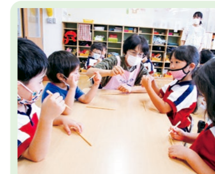
正しい箸の持ち方について(年中組)