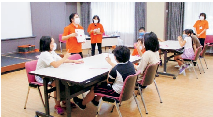
熱中した「クイズハイ&ロー」

少年仲間づくり教室「レクリエーション活動」が9月11日に行われ、教室生17名が参加しました。国見町レクリエーション協会の皆さんを講師に迎え、様々なゲームを体験し仲間との交流を深めました。手をたたく回数的人数で集まる「数集まり」、おはじきを使つての「心を合わせて数合わせ」、王様・お姫様を決めて行う「王様