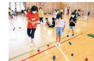
真剣に取り組んだ「日レクボール」

国見つ子わんぱく広場では、9月11日に国見町レクリエーション協会の皆さんを講師に迎え、児童46名が参加しラダーゲッター、日レクボール、フライングディスク、カーレットの4つのニュースポーツを体験しました。