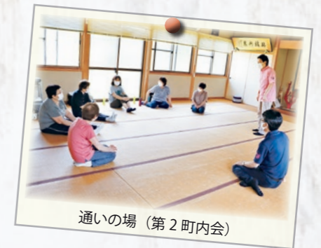
通いの場（第2町内会）

A. 市街化調整区域は法律による規制があり、すぐに大きく変えることは困難です。また、地元工務店により建築した場合の優遇措置についてはどのような方法が有効か検討します。 例) 町内事業者が移住者を呼び込み、建築及び居住した場合の給付金など。