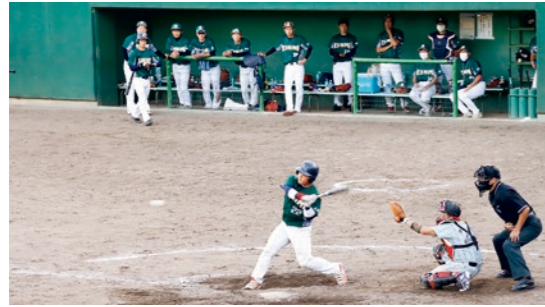
最後まで諦めずに戦い抜きました