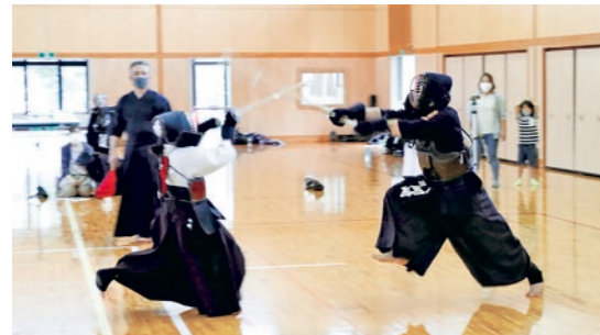
一瞬に勝負をかけます

町総合計画は、「命を大切に 誰もが幸せに暮らすまち くにみ」を基本理念とし、令和3年度から10年間のまちづくりの指針となっています。