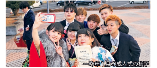
—昨年1月の成人式の様子—