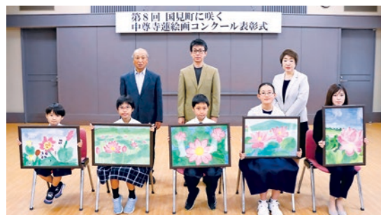
最優秀賞（町長賞）を受賞したみなさん

この大会は、青少年の健全育成を目的として行われ、子どもたちが日ごろの鍛錬の成果を存分に発揮しようと熱戦を繰り広げました。