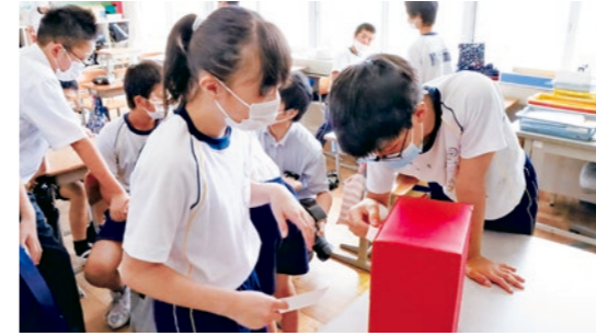
メッセージカードを手作りポストに投函する児童

啓発活動では、くにみ幼稚園の園児と県北中学校の生徒へ反射材や啓発チラシなどの交通安全グッズを配布し、子どもたちの事故防止への意識高揚を図りました。