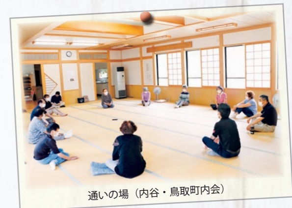
通いの場（内谷・鳥取町内会）