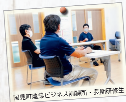
国見町農業ビジネス訓練所・長期研修生

これまでのタウンミーティング「真コラポとく」では、突然の訪問にもかかわらず皆さんに温かく迎え入れていただき、時には世間話も交え、じっくりと時間をかけて意見交換を行うことができました。 タウンミーティングは今後も不定期の開催にはなりますが、町長が皆さんのもとへ出かけ、直接対話をし、意見交換ができる機会をつくりたい。要望があれば伺いますので、ご相談ください。 国見町をどのように維持・発展させていくのか、今後のより良いまちづくりのため、皆さんの意見を引き続きお聴かせください。