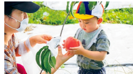
大きく実った「まるみ白桃」を収穫する参加者

国見小学校の6年生や教職員、保護者などが参加。スマートフォンの利用について改めて学びなおす機会となりました。