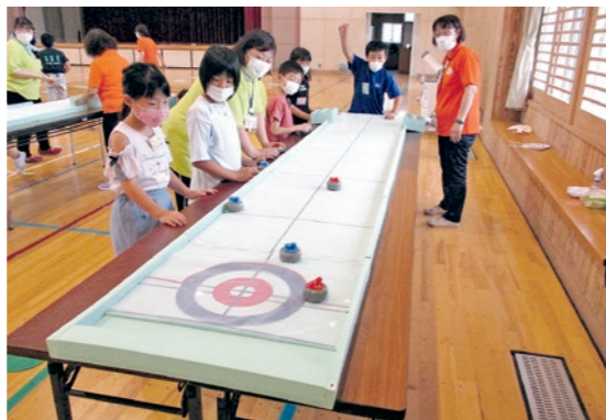
卓上で行うカーリング「カーレット」

国見つ子わんぱく広場では、9月11日に国見町レクリエーション協会の皆さんを講師に迎え、児童46名が参加しラダーゲッター、日レクボール、フライングディスク、カーレットの4つのニュースポーツを体験しました。