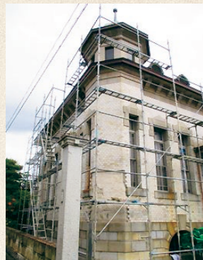
修復作業中の「洋館」

11月頃には、優美な姿を取り戻した「洋館」を皆さまにお披露目できると思います。今後も、町として歴史的遺産の維持と有効活用に取り組んでいきます。