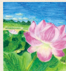
一般の部 最優秀賞作品