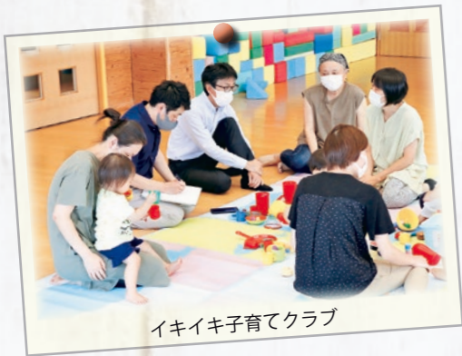
イキイキ子育てクラブ

A. 給食費無償化は大きな財源が必要ですが、子育て支援の核として令和3年度から実施しました。幼稚園での水曜日の給食は、認定こども園の検討に併せ検討します。