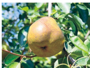
収穫間近のラ・フランス

私は、生産者の皆さんがひとつひとつ丁寧に一生懸命に育てた国見町の果物は、どこにも負けないぐ