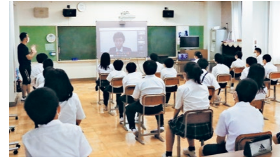
リモート講演会に参加した児童ら

このプロジェクトは、今年8月の大雨で被害が広がった九州の被災地へ国見町からエールを届けようと、国見郵便局が企画しました。投函されたメッセージカードは被災地の郵便局で展示され、被災者の皆さんに元気を与えています。