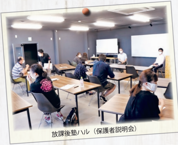
放課後塾ハル（保護者説明会）

Q. 女子中学生の夏制服（七分袖）は今の夏の気候に合っていない。素材も厚く、気候変動に適した素材にするなどの見直しが必要。