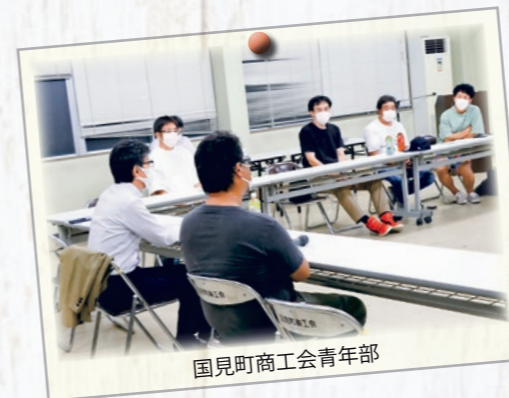
国見町商工会青年部

A. 空家の適正管理は、機を見て所有者にお知らせをしています。なお、危険な家屋は特定空家の認定を進め、除却などの勧奨を進めます。