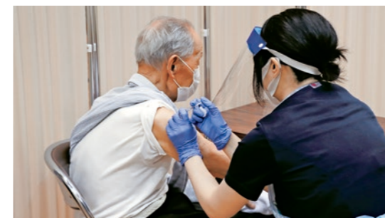
ワクチンは2回接種を行います

同会は、町民の憩いの場である観月台公園の植栽管理や清掃などの美化活動を行っています。