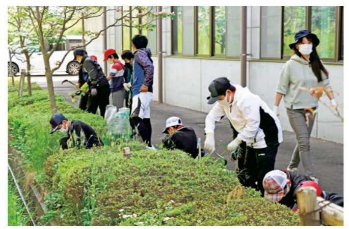
定期練習前にみんなで草むしり