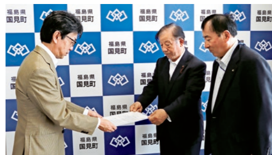
渋谷会長から要望書を受け取る引地町長

園児たちは左右をしっかりと確認し、手を挙げて手作りの横断歩道の上を得意げに渡っていました。