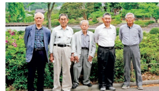
いつもきれいな公園をありがとうございます

飼い犬への狂犬病予防注射は、狂犬病予防法により毎年1回の実施が義務付けられています。まだ予防注射を受けていない場合は、最寄りの動物病院で受けさせましょう。