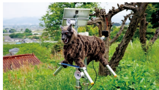
農作物を守るモンスターウルフ

要望書を受け取った引地町長は、「町として要望を踏まえ、速やかに対応します。」と述べました。