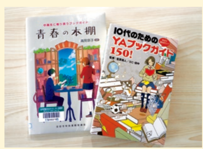
迷った時はブックガイドを参考に