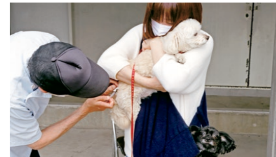
狂犬病の予防注射は飼い主の義務です

第25回国見町フォトコンテストの巡回展示が福島信用金庫国見支店、国見郵便局、道の駅国見あつかしの郷などで行われました。今回は「未来に引き継ぎたい国見の思い出」がテーマの作品の中で入賞した10作品が展示され、町の魅力を発信しました。なお、国見町役場1階アカマツの広場でも常設展を開催しています。