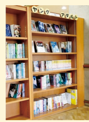
一般の方にもおすすめです