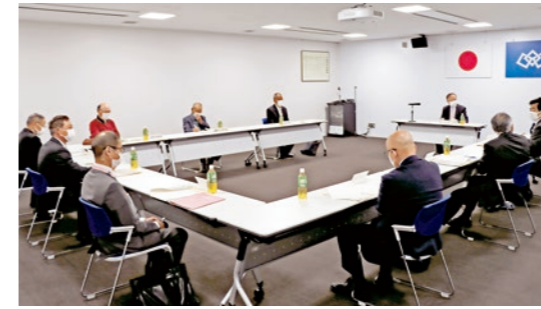
各団体が丸となってまちづくりに取り組みます

イノシシなどの害獣が装置に近づくとセンサーが感知、オオカミの声を基本に様々な音が鳴り響きます。目や足元のLEDも激しく点滅し、視覚でも威嚇をして害獣を追い払うことで、鳥獣被害の減少が期待されています。