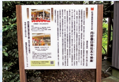
▲案内看板が新しくなりました

感染予防により様々な制限を受ける現在の生活で、先人から受け継がれてきた祭事や伝承が体験・実施できず、さまざまな事で苦悩する関係者の一端を伺うことができました。