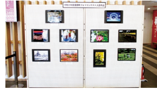
道の駅国見あつかしの郷での展示

同協議会は、町や議会、町内会長連絡協議会、商工会、JA、婦人会をはじめとする各団体代表者により構成され、町の活性化に向けた活動に取り組みます。