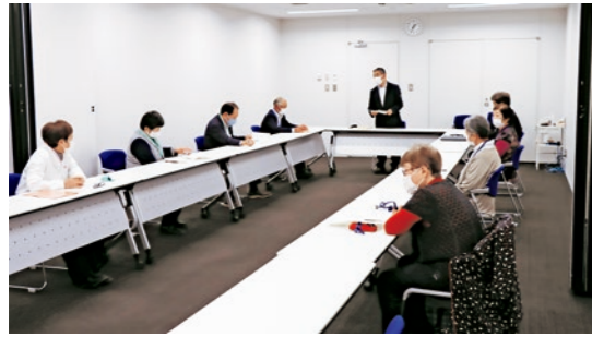
出会いのきっかけづくりを応援します