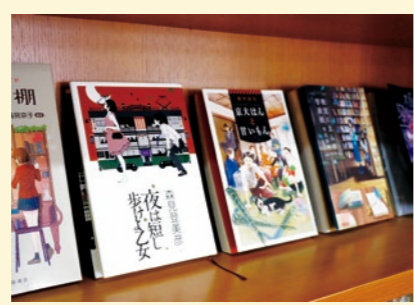
おすすめの本がたくさん!!