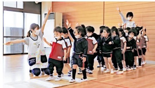
しっかり手を挙げてわたりましょう