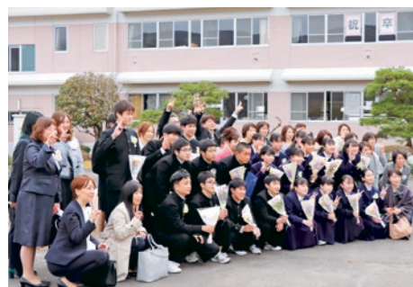
最後はみんな笑顔で(県北中卒業式)