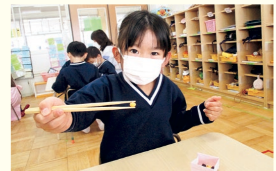
正しい箸の持ち方について (年長組)