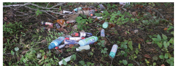
不法投棄はダメ！ゼツタイ！