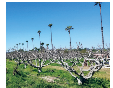
視察先のネクタリン畑

アメリカのカリフォルニア州で有機栽培の農場や市場を視察して、アメリカの農家の経営実態や現状、栽培技術などを学びました。有機栽培先進農家から直接話が聞けたことは貴重な経験でした。アメリカと日本の農業政策や経営方法の違いについても知ることができ、勉強になりました。