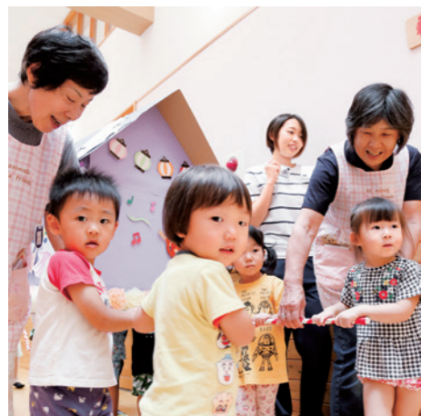
みこし 神輿もくりだした保育所と いきいき子育てクラブ夏まつり