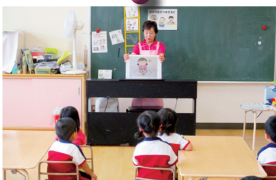
おやつを食べすぎるとどうなるかな（年中組）