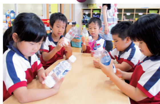
こんなにたくさん砂糖が入っているの？（年長組）