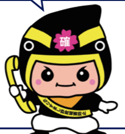
なりすまし詐欺被害防止 マスコットキャラクター カクニンジャー福くん