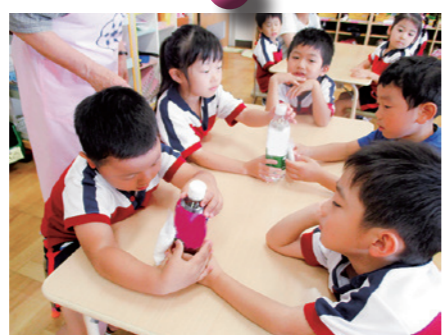
こんなにたくさんお砂糖が入っているの？