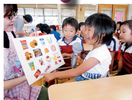
好きなおやつはどれかな？

町では、食生活改善推進員のみなさんと栄養士が出向いて、くにみ幼稚園の子どもたちを対象に食育教室を開催しています。7月は2回開催しました。