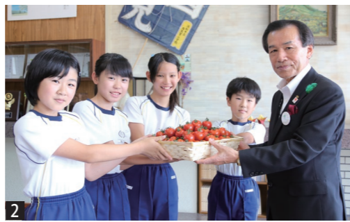
1 トマトをおいしそうに味わう児童ら 2 児童らにトマトを贈呈する太田町長