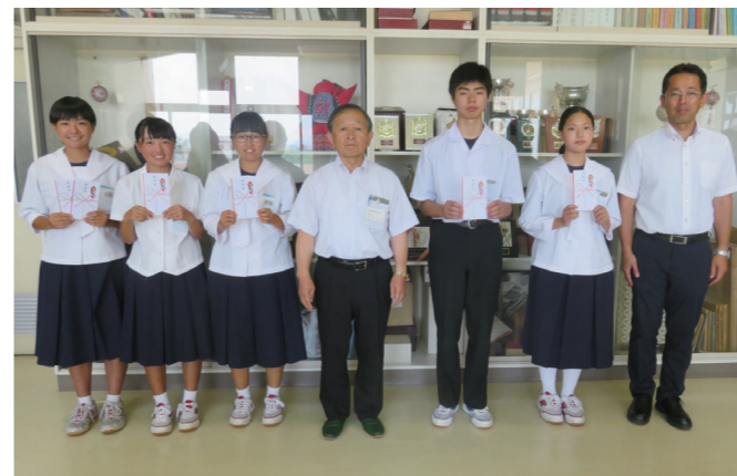
▲奨励金を手に大会での活躍を誓うみなさん▼