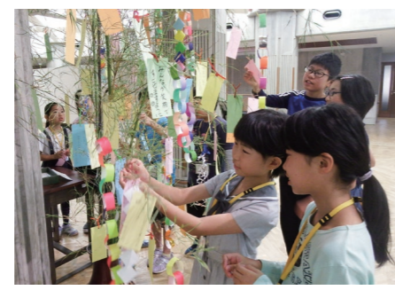
短冊を飾る子ども司書