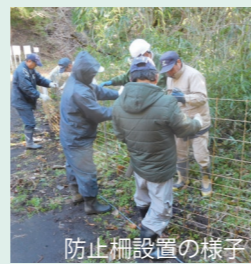
防止柵設置の様子

侵入防止柵(ワイヤーメッシュ柵)の設置を推進し、設置後に適正な管理を行う集落・地区に対して、侵入防止柵の修繕用資材を交付しています。