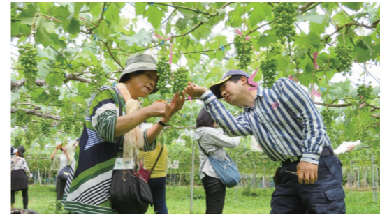
ブドウの摘粒作業を体験するツアー参加者

発表されたのはクリームパンで有名な八天堂（広島県）とコラボした「国見ももバーガー」など4商品。発表会では、畠利行県副知事が「全国に誇れる商品にしましょう」とあいさつ。来場者にも「国見ももバーガー」が配られ、好評でした。