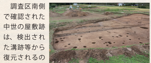
▲中世の屋敷跡(区画溝と柱穴)

跡一帯が狩猟の場であったことが分かり、タイプの異なる落とし穴が認められることから、長期間継続した狩猟場であったと考えられます。