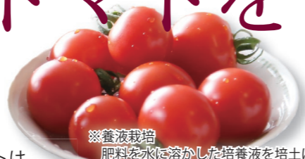
※養液栽培 肥料を水に溶かした培養液を培土に供給して栽培する方法で、高品質のトマトを安定的に生産することができます。

「くにみ農業ビジネス訓練所」で養液栽培※された甘くておいしいトマトは、国見町を代表する新しいブランド野菜として注目されています。