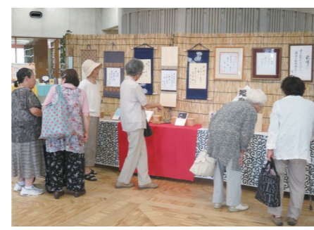
くにみ短歌会と国見町陶芸サークルによる作品