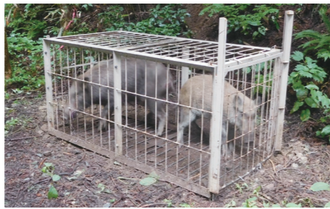
町内で捕獲されたイノシシ

狩猟者の高齢化による有害鳥獣捕獲の担い手不足が深刻化し、狩猟者の育成・確保が急務となっています。また、農作物被害により営農意欲が低下し、耕作放棄地が増え、さらなる鳥獣被害を招くという悪循環が生じており、被害額の数字に表れる以上に深刻な状況となっています。