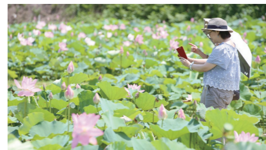
優雅に咲き誇る中尊寺蓮

要望活動では、太田町長が開業1周年を迎えた道の駅国見あつかしの郷の状況を説明し、安全・安心な地域交通の早期実現に向け、道路整備予算の確保とさらなる事業推進を求める要望書を財務省岡本薫明主計局長らに手渡しました。