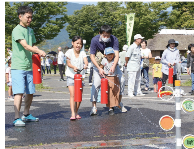
昨年の防災訓練の様子