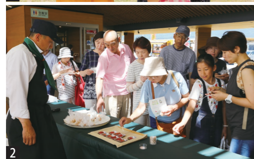
1 上手にトッピングできました♪ 2 多くの来場者で賑わう試食ブース