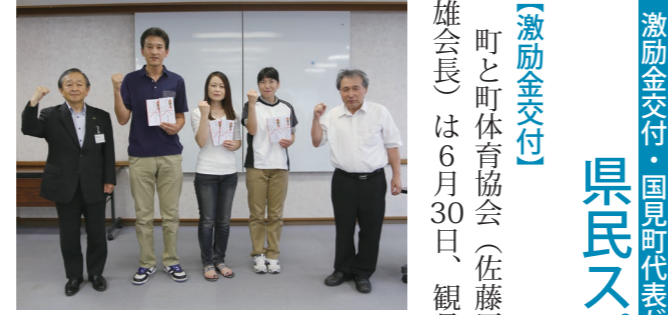
激励金を手に活躍を誓うみなさん

台文化センターで、県民スポーツ大会に国見町代表として参加するオール国見(ソフトボール競技)、ブラックパンサー(家庭バレーボール競技)、国見ST(ソフトテニス競技)の3団体に激励金を交付しました。 【国見町代表が健闘】 県民スポーツ大会が7月8日、伊達市と伊達郡管内で開催され、猛暑の中、各競技で熱戦が繰り広げられ