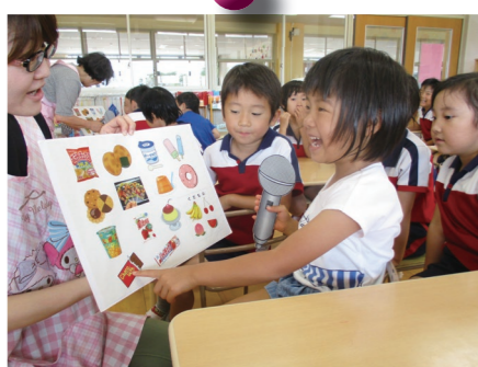
好きなおやつはどれかな？

町では、食生活改善推進員のみなさんと栄養士が出向いて、くにみ幼稚園の子どもたちを対象に食育教室を開催しています。7月は2回開催しました。