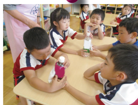
こんなにたくさんお砂糖が入っているの？