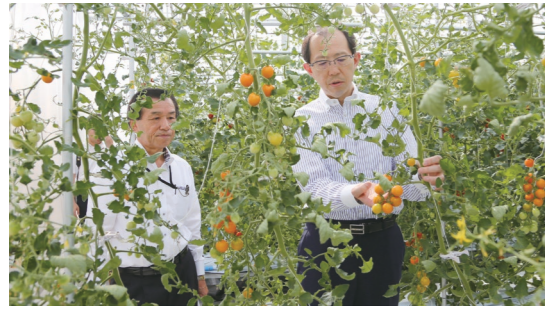
養液栽培トマトの生育状況を確認する内堀知事（右）