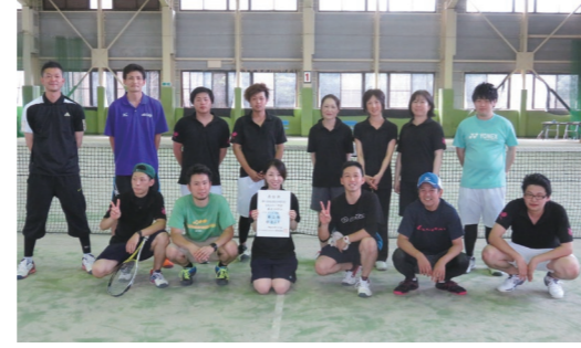
第3位に輝いた国見STのみなさん

台文化センターで、県民スポーツ大会に国見町代表として参加するオール国見(ソフトボール競技)、ブラックパンサー(家庭バレーボール競技)、国見ST(ソフトテニス競技)の3団体に激励金を交付しました。 【国見町代表が健闘】 県民スポーツ大会が7月8日、伊達市と伊達郡管内で開催され、猛暑の中、各競技で熱戦が繰り広げられ