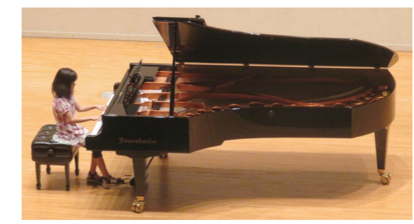
ベーゼンドルファーの音色を堪能する参加者

ベーゼンドルファー夏の特別試弾会が7月14日と15日の2日間、観月台文化センターで開催されました。 町の文化芸術振興のため、グラランドピアノ「ベーゼンドルファー」とホール舞台を気軽に体験してもらおうと企画したもので、2日間で18組が参加しました。参加者は、世界屈指の名器の音色とホール舞台の響きを十分に堪能しました。