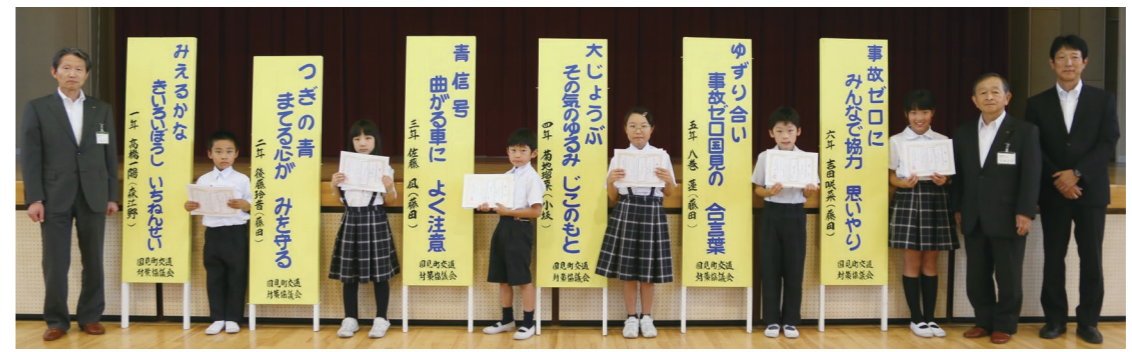
交通対策協議会長賞(最優秀賞)を受賞したみなさん

集落環境点検を行うことで、餌となる放任果樹の把握、緩衝帯の整備など、生息環境管理を含めた総合的な対策の必要性と有効性について町民のみなさんに理解してもらい、集落の自主的な取り組みへとつなげていきます。