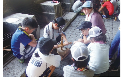
火おこしに挑戦する子どもたち

ほか、野外クッキングやキャンプファイヤーなどにも挑戦し、仲間たちと協力しながら楽しいひとときを過ごしました。 自然の中で生活を共にし、みんなで協力する姿勢を身につけた子どもたちは、ひとまわり大きく成長した姿を見せてくれました。仲間たちとの絆を深めた3日間は、子どもたちに