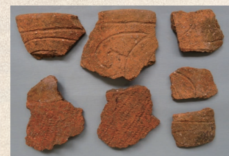
▲埋蔵跡から出土した縄文後期の土器

県宮貝田地区ほ場整備事業に伴い、町では平成29年から30年の2か年にわたって長障子遺跡(貝田字長障子・竹ノ内地内)の発掘調査を実施し、7月末をもって予定の調査を終了しました(調査面積約4,400㎡)。