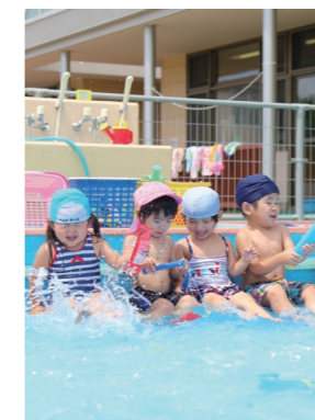
藤田保育所のプールの時間。夏の空に、子どもたちの元気いっぱいな歓声が響き渡りました。