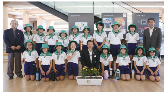
町に「人権の花」を届けた国見小学校園芸委員のみなさん

県北中学校で行われた啓発活動には、生徒会役員の生徒のみなさんも参加し、登校する生徒にポケットティッシュなどを配りながら、犯罪や非行の防止を呼びかけました。