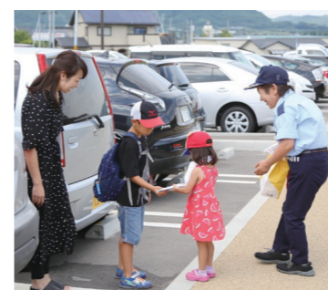
交通事故に気を付けてね

国見町交通対策協議会は7月23日、道の駅国見あつかりの郷で交通安全啓発活動を行いました。 会員のみなさんは、来場者にチラシや啓発グッズを配布しながら、交通事故防止を呼びかけました。