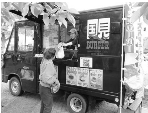
商標登録もされた国見バーガーなどのソフト面を推進

町長 道の駅そのものが情報発信の拠点と考えている。食文化や歴史・観光、イベントの情報発信など、各種報道機関と連携し、情報をいかに外に出していくかが重要な課題である。応援団ツアーやふるさと納税、交流自治体などとの連携を図りながら、縦横無尽にでき得るものをリストアップし、チャレンジしていくことが必要である。