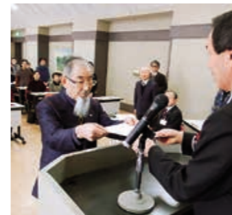
阿津賀志学級閉講式