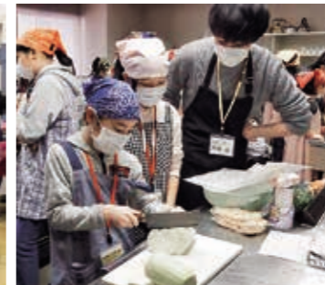
少年仲間づくり教室・郷土料理

ありがとうございます 公民館教室 閉講式 年間を通してさまざまな活動を行ってきた公民館教室が全ての活動を終え、閉講式を行いました。