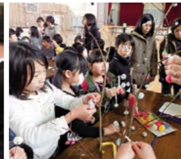
国見っ子わんぱく広場・団子さし