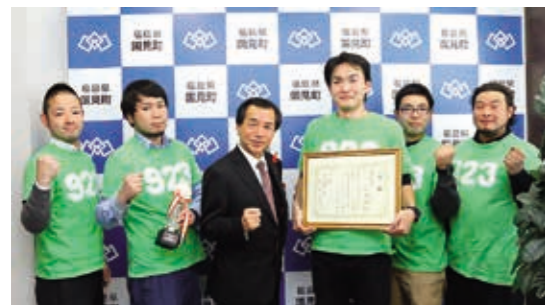
受賞を報告した商工会青年部のみなさん

国見・桑折両町の交通・防犯団体関係者が出席し、年末年始の事件事故防止に向けて誓いを新たにしました。出動式終了後にはハシドラッグ国見店などで街頭啓発を行い、買い物客へ交通安全や防犯の推進を呼びかけました。