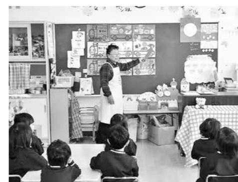
年中児『バランスよく食べよう』

町では食生活改善推進員のみなさんと栄養士が出向いて、くにみ幼稚園の子どもたちを対象に食育教室を開催しています。12 月は 6 回実施しました。