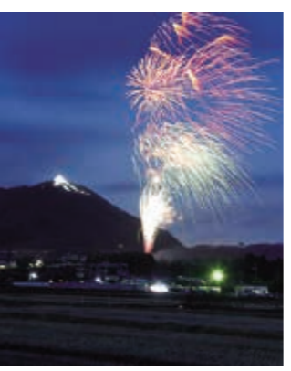
あつかし山ビッグツリー点灯式が12月23日に行われ、点灯式では花火が打ち上げられました。