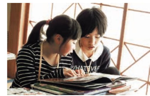
この本おもしろいね

「おはなし会」に続き、450冊以上の本から図書室に入れたい本を選ぶ選書会が行われました。選書会の結果は図書室よりなどで公表され、得票数の多い本から図書室で購入し、貸し出します。また、瓶子先生には今後子ども司書の読み聞かせの講師として参加していただき、来年2月には「国見