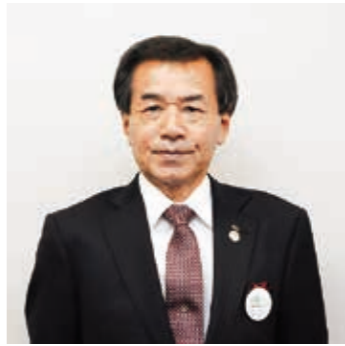
国見町長 太田久雄