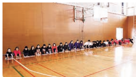
気持ちを込めて清掃中