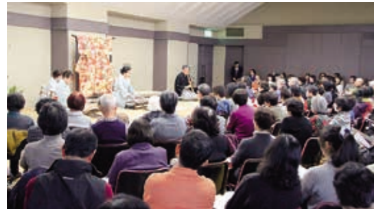
和楽器の音色を楽しむ大勢の参加者