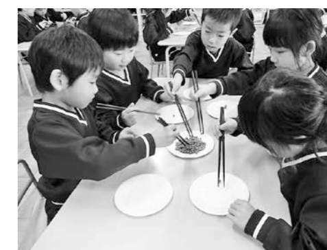
年長児『正しい箸の持ち方について』