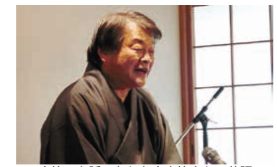
大笑いを誘ったしお家小笑さんの落語

三学級合同学習「年忘れ落語を聞く会」が12月9日、観月台文化センター第一和室で開催され、約80人が参加しました。「ふくしま素人落語の会」の7人が出演し、それぞれに得意の演目を披露しました。