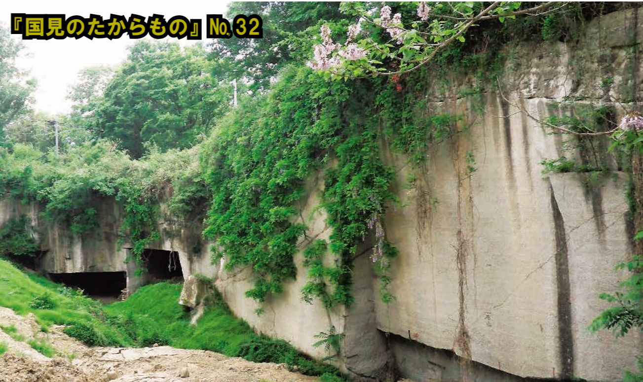
国見石の石切り場跡（所在地：大字森山字西国見地内）

江戸時代末期頃から町内で採石が盛んになり、最盛期には12カ所程の石切り場が存在したと言われています。国見石は町内で採れる石材の総称で、かつては採掘地の地名から小坂石、山崎石、石母田石などと呼ばれ、柔らかくて加工しやすく、火に強いので、石蔵やかまど等の材料に使われました。特に石蔵は「富裕の象徴」として所有することがステータスであり、安価に短期間で建てられることから広く普及し、現在でも町内に500棟以上あり、国見町固有の景観を形成しています。