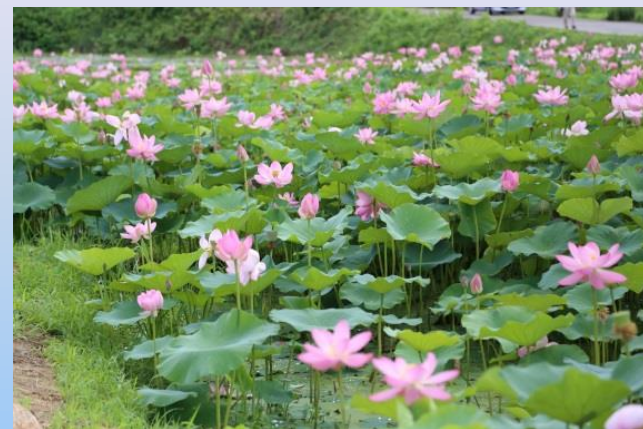
西大枝の中尊寺蓮池