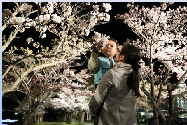
観月台公園の夜桜