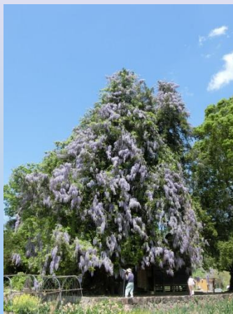
鳥取深山神社の藤