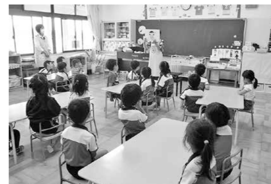
年長組「おやつについて考えよう」

町では食生活改善推進員のみなさんと栄養士が出向いて、くにみ幼稚園の子どもたちを対象に食育教室を開催しています。5月と6月は次の内容で実施しました。