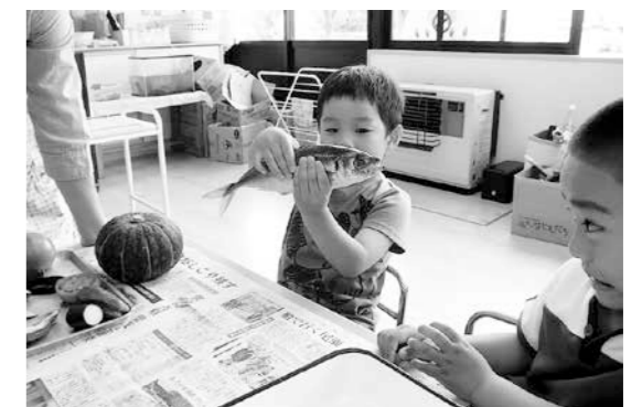
年中組「食材あてクイズ」