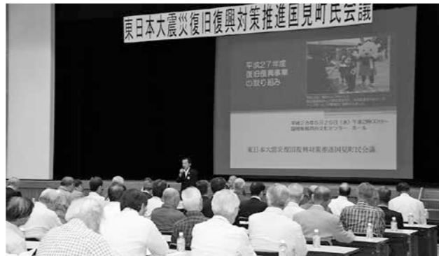
親月台文化センターホールで開催された町民会議