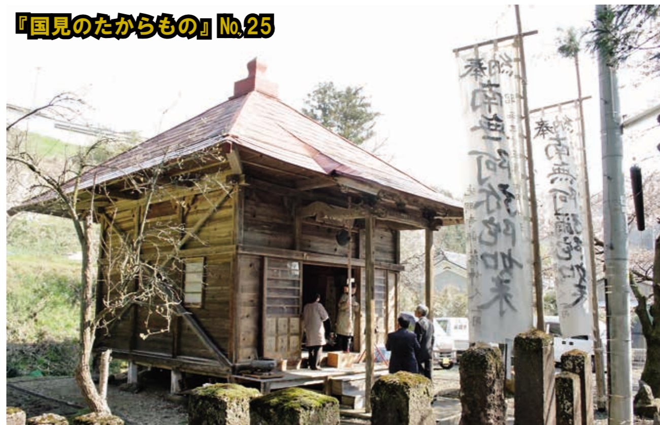
三常院 (所在地: 国見町大字光明寺字鹿野地内)