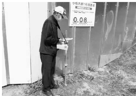
空間線量率測定の様子

町内の仮置場で住民による監視を実施している仮置場は、森江野方部1号、藤田方部1号仮置場に次いで3箇所目となります。