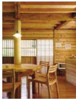
リフォームした住宅の例

その他にも、空家除却費用の低利子融資や多世代同居のためのリフォーム支援など様々な制度があります。住宅のことでお悩みの人、空家の解体や活用を考えたい人は、お気軽に建設課まで問い合わせください。