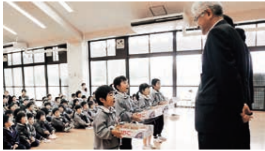
おいしいいちごありがとうございます