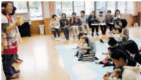
みんなで手遊び楽しいな

伊達地区で生産された、安全でおいしいいちごを管内の子どもたちに食べてもらおうと贈呈されたものです。園児は、真っ赤な甘いいちごを口いっぱいにはおぼりながら、地域の味を楽しみました。