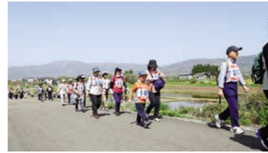
歩いて心も体も健康に

旧佐藤家住宅での内谷太々神楽鑑賞、奥山家洋館でのディナーコンサート、果樹園での桃の実摘み体験、小坂婦人会による手料理のおもてなし、小坂地区での桐目木山散策など新緑の国見町を2日間満喫してもらいました。