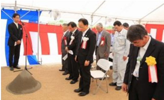
仮設汚泥乾燥施設安全祈願祭の様子(県北浄化センター内)

計画どおりに運転が開始されれば、平成29年3月までにすべての保管汚泥を処理し、運転を終える予定です。