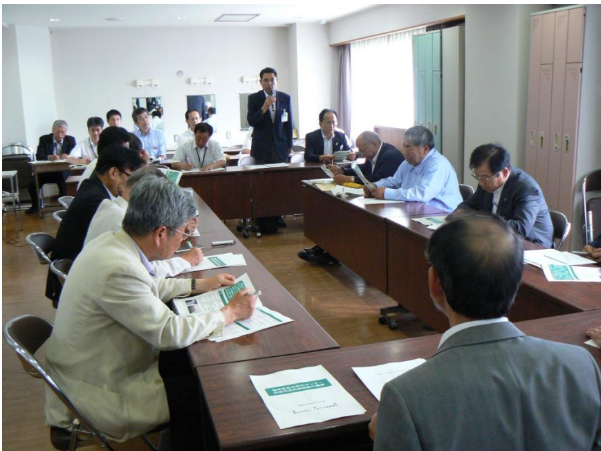
県担当者が施設の安全性などを説明(役場仮庁舎)

北浄化センターに一時保管している放射性物質を含んだ下水汚泥を乾燥させ、約4分の1から5分の1に減容するもので、その後、飯館村の減容化施設に搬出されます。