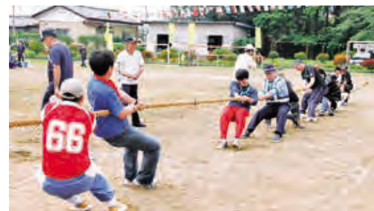
白熱した綱引きの結果は…?

ファミリーシアターが10月29日、国見小学校体育館で開催されました。国見小学校児童は「混声4重唱とあそぼう！オペラってなあに？」と題した、オペラと声楽の世界を楽しみながら学びました。オペラ「セヴィリアの理髪師」の中では、サプライズで先生が登場し、生徒たちは大盛り上がりでした。