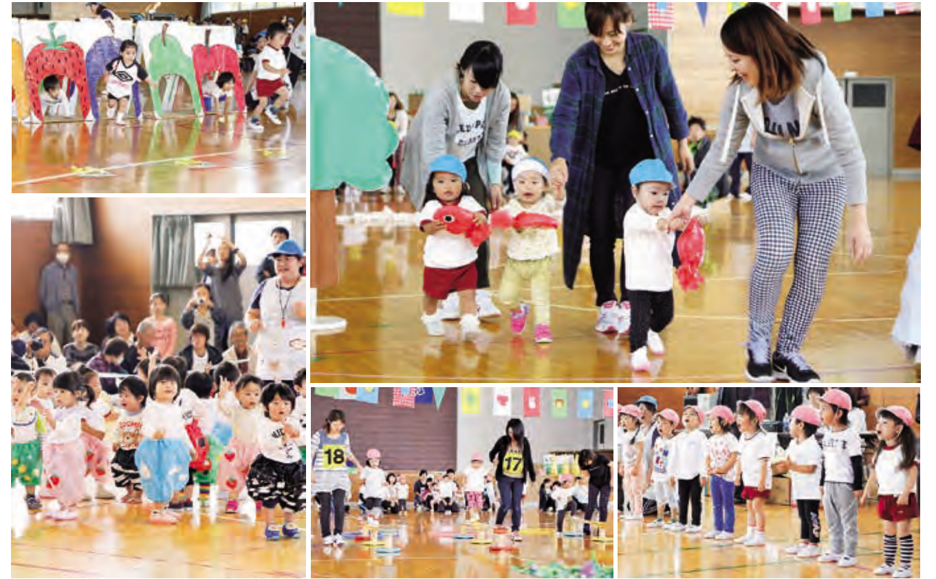
▲ 10月10日 藤田保育所運動会

今年も幼小中一貫教育事業「くにみっ子まつり」が行われ、くにみ幼稚園・国見小学校・県北中学校の子どもたちが一堂に集まり、ビッグアート作成や交流活動を行いました。県北中学校美術部がデザインした原画を縦約4m、横約6・5mの巨大なちぎり絵にし、班ごとに作成しました。 作成したビッグアートは10月27日、国見小学校体育館で行われた「くにみっ子のつどい」でお披露目されました。くにみっ子のつどいでは、学校ごとにダンスや合唱の発表もあり、最後に、全員での合唱が行われました。体育館には子どもたちの元気な歌声が響き渡っていました。