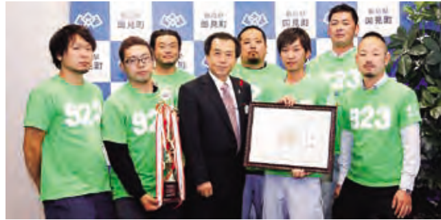
太田町長へ結果を報告する商工会青年部のみなさん

国見町商工会青年部は、「とっとりバーガーフェスタ2015」(10月11日から12日)及び「ふくしまバーガーサミット2015 in 桑折」(10月18日)に出場し、国見バーガーをPRしました。