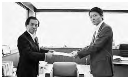
永尾河川国道事務所長へ要望書を渡す町長