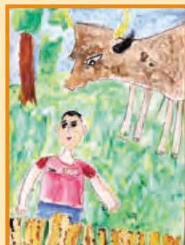
『かっこいいな』 松浦 謙也