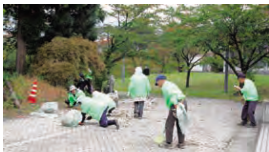
美化作業ありがとうございました