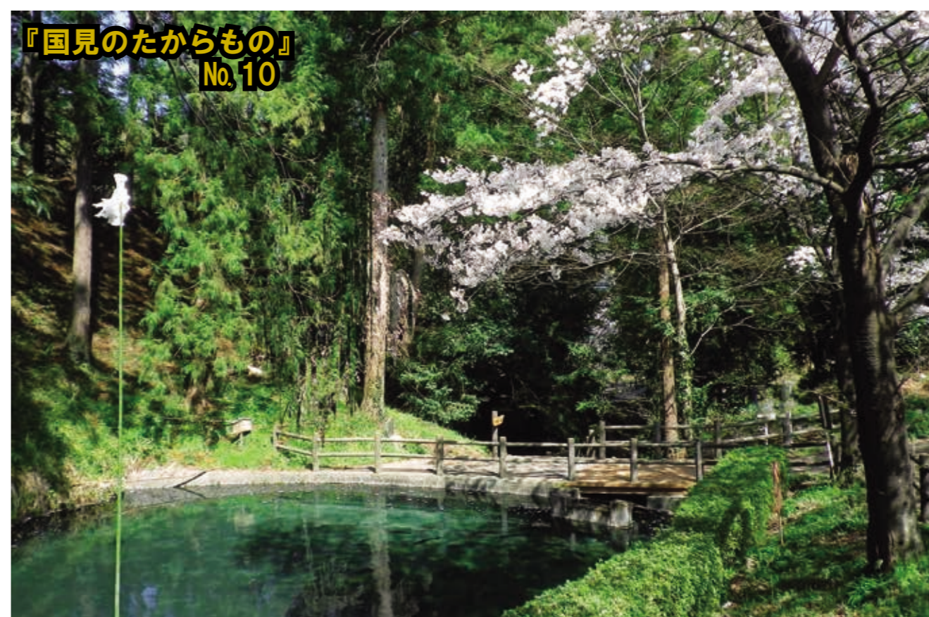
『国見のたからもの』 No.10

※歴史的風致とは 日本には、そこでしか感じるできない風情や情緒があり、それらは、そこに住む人々の営みや歴史、伝統によって形成されています。「歴史的風致」とは、地域に住む人々が受け継いできた伝統や活動と、歴史的建造物が一体となって形成した良好な環境です。