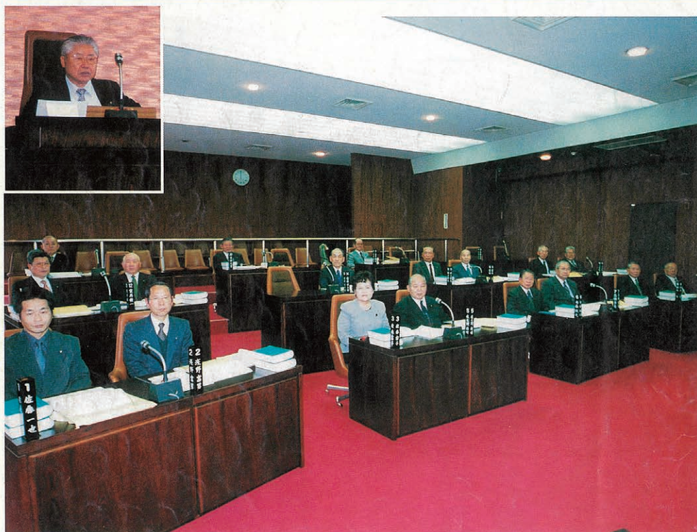
サヨナラ議会閉会（今任期最後の議会が8日間の日程を終え、閉会しました）