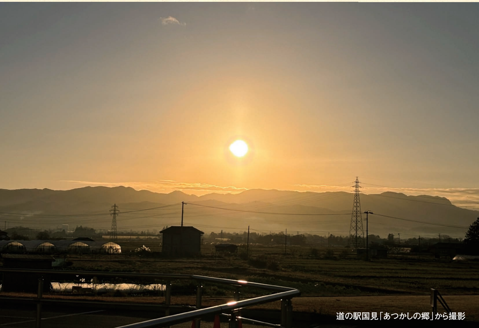
道の駅国見「あつかしの郷」から撮影