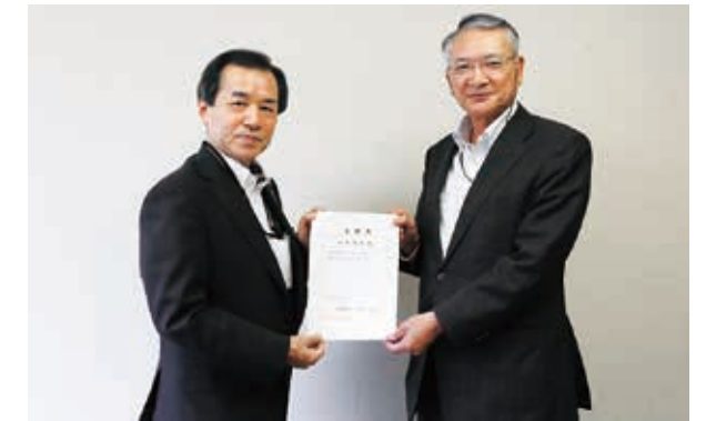
太田町長から委嘱状を交付